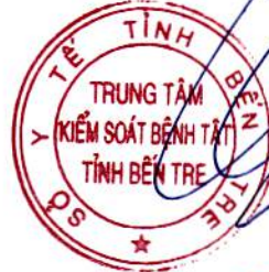
Phạm Hồng Thái