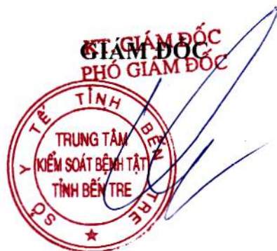
Phạm Hồng Thái