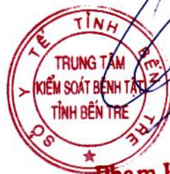
Phạm Hồng Thái