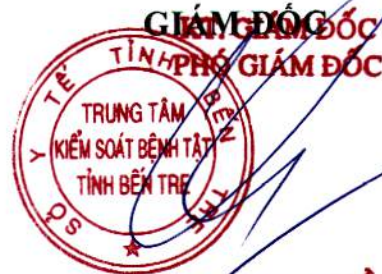
Phạm Hồng Thái