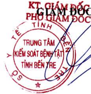
Phạm Hồng Thái