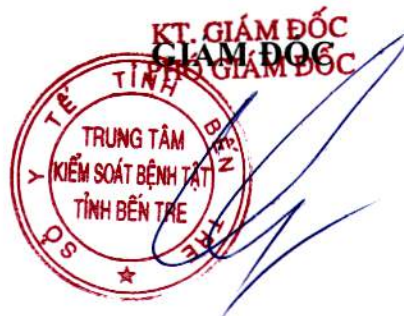
Phạm Hồng Thái