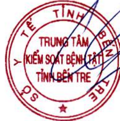
Phạm Hồng Thái