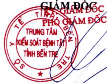
Phạm Hồng Thái