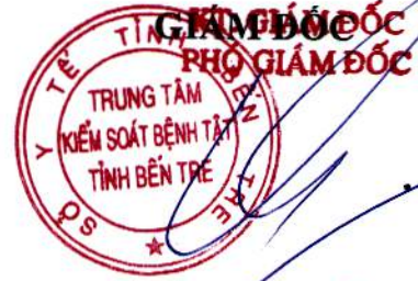
Phạm Hồng Thái