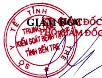
Phạm Hồng Thái