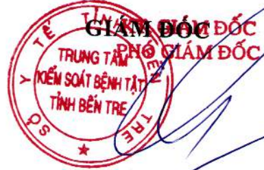
Phạm Hồng Thái