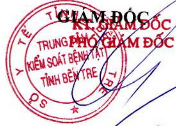
Phạm Hồng Thái