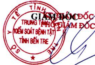
Phạm Hồng Thái