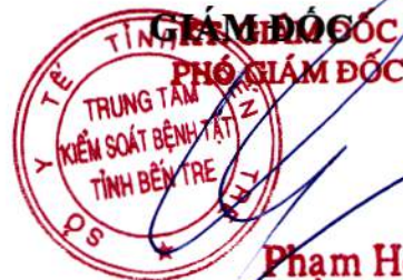
Phạm Hồng Thái