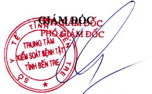
Phạm Hồng Thái