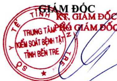
Phạm Hồng Thái