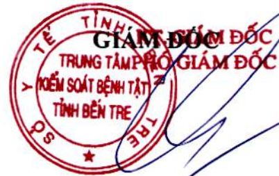
Phạm Hồng Thái