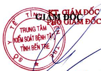
Phạm Hồng Thái