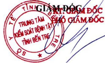
Phạm Hồng Thái